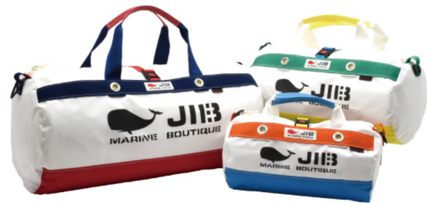
「ダブルバッグ」M 20,900円、S 17,600円、SS 16,060円

☎0798-61-5123 🕒11:00~20:00(LO19:15) 📍ららぽーと甲子園に準ずる 西宮市甲子園八番町1-100 ららぽーと甲子園2階