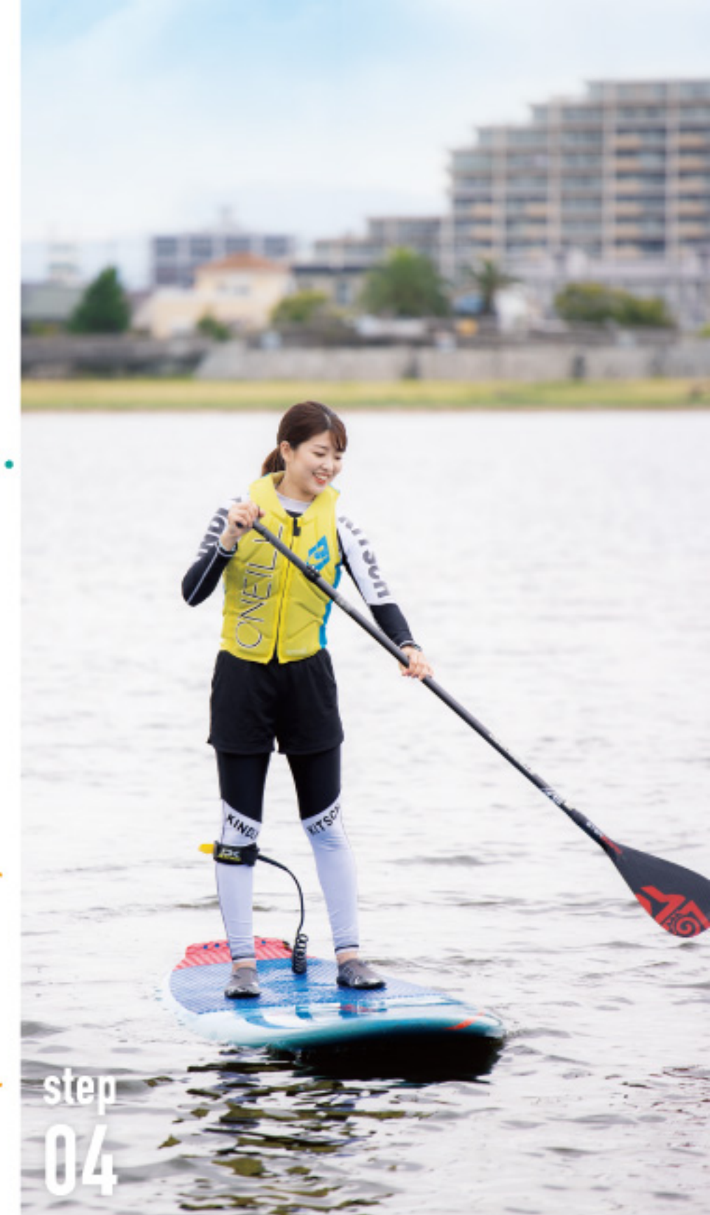
step 04 ボードに乗ることやパドルの使い方に慣れてきたら、いよいよスタンドアップ！足は肩幅ぐらいに開くとGOOD。

各体験プラン 11月末までの土日祝(要予約) 時間:9:30~12:30 持ち物:水着、タオル、日焼け止め、シャンプー類、マスク