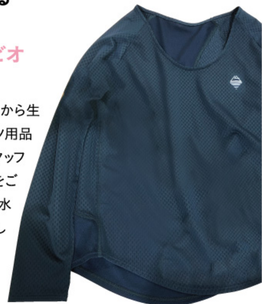
「FOOT MARK NATURAL レディスラッシュガード長袖」4,730円

☎0798-81-6933 🕒10:00~20:00 📍ららぽーと甲子園に準ずる 西宮市甲子園八番町1-100 ららぽーと甲子園2階