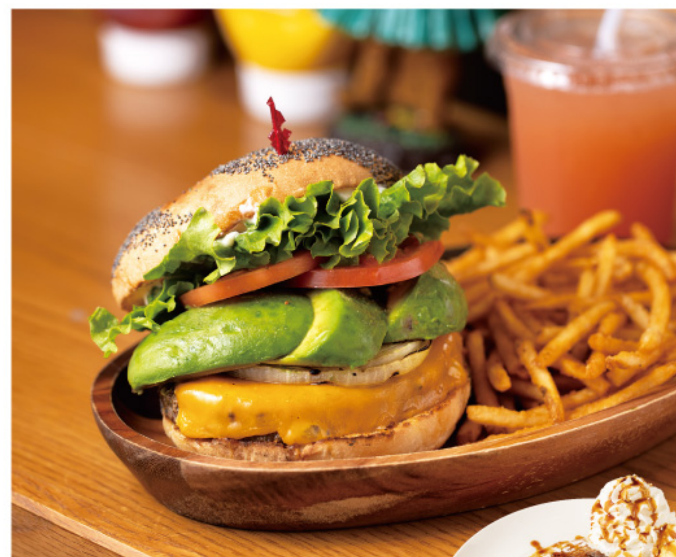
「厚切りチェダーアボカドバーガー ランチセット」 1,550円