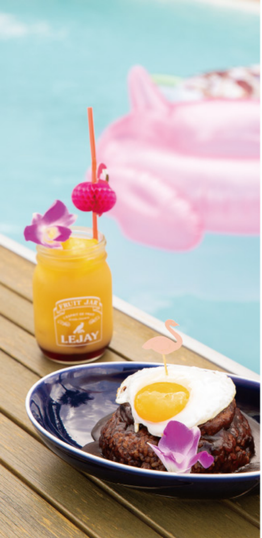
「Hawaiianロコモコ」1,280円、 「カシスバイン」750円