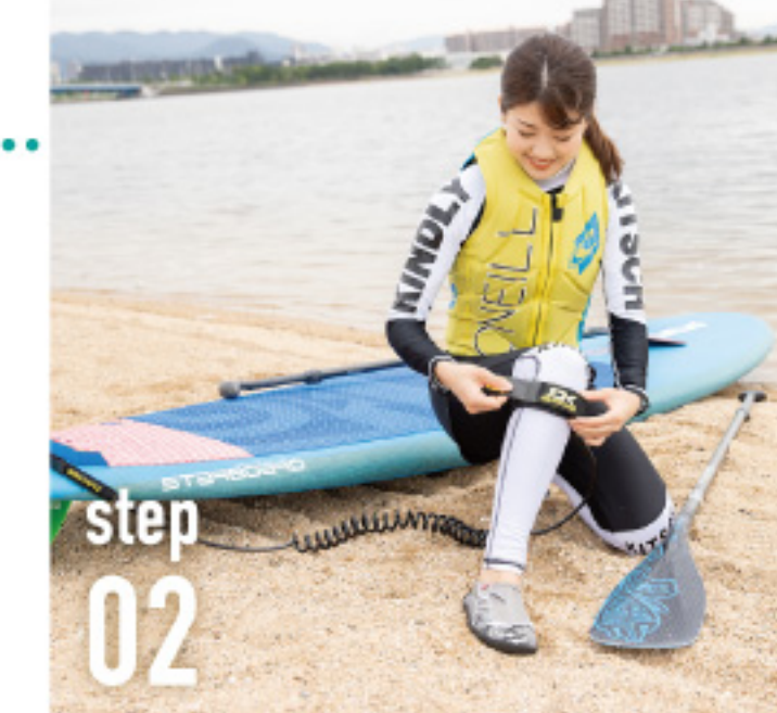
step 02 リーシュコードを膝下に装着し、海に出る準備をします。準備体操も忘れずに。

step 04 ボードに乗ることやパドルの使い方に慣れてきたら、いよいよスタンドアップ！足は肩幅ぐらいに開くとGOOD。