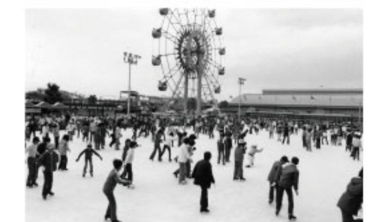
阪神パークオープンスケートリンク(1980年代頃)

現在のららぽーと甲子園には、昔「阪神パーク」という遊園地があり、冬になるとオープンリンクが出現。また、阪神甲子園球場にスキージャンプ台が設置されたことも!