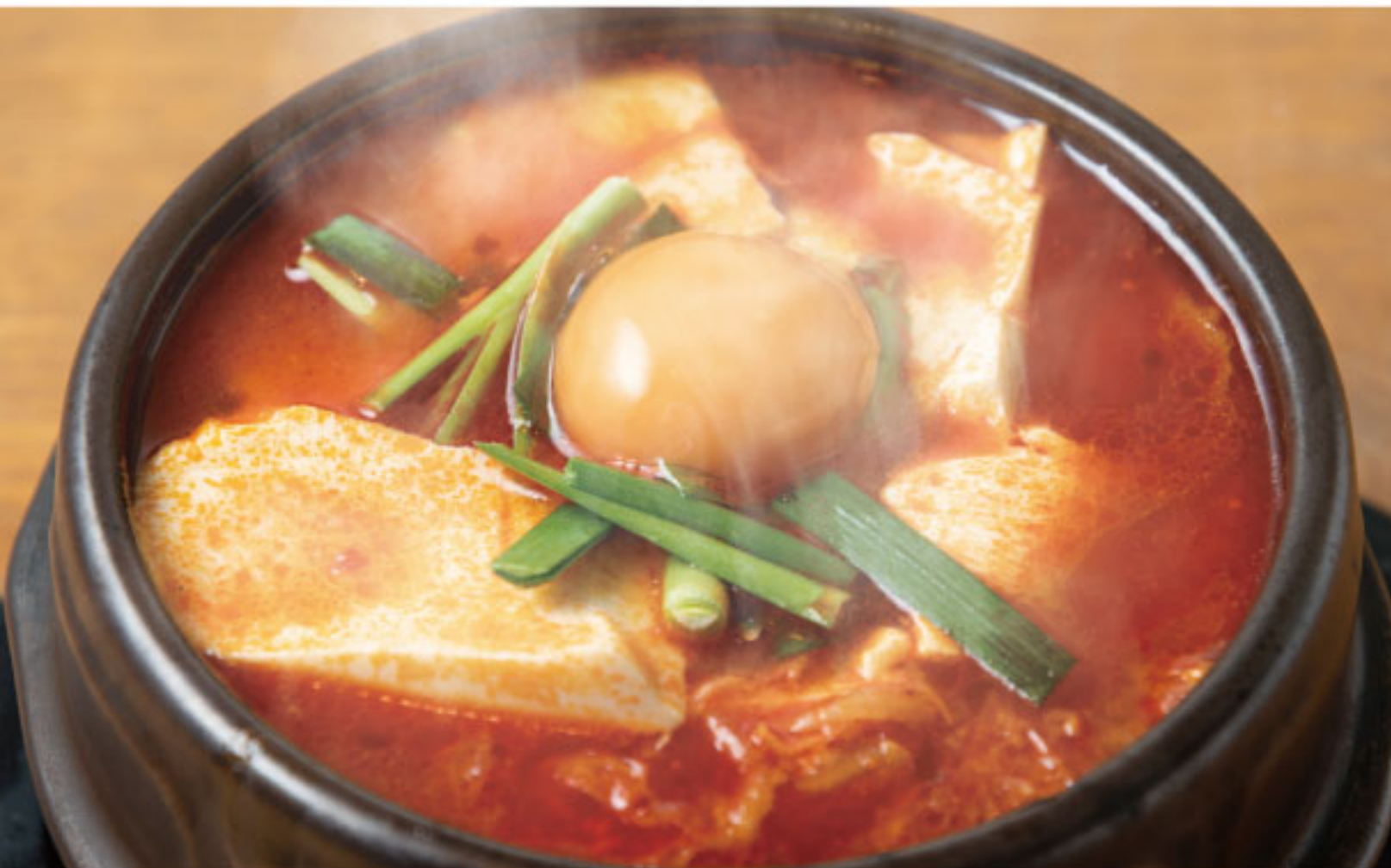
「海鮮サンドゥップランチ」1,150円

アイススケートの後は体の芯までポカポカになるあったかグルメはいかが? 心も体も満たされる4店舗をピックアップしました。