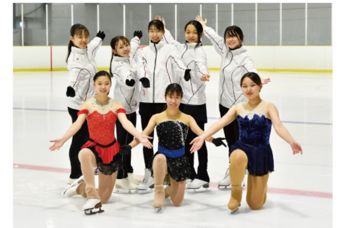
武庫川女子大学スケート部の皆さん