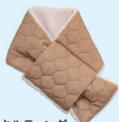
「キルティング ポアコンビマフラー」 3,630円