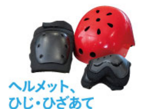
ヘルメット、ひじ・ひざあて