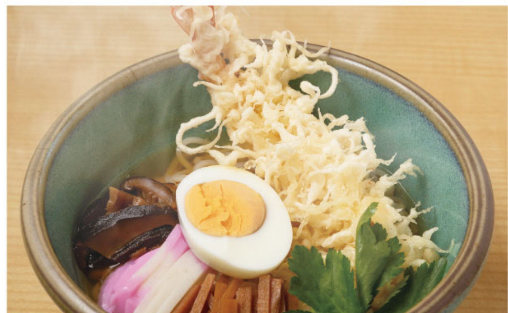
「源さん(温・しらいと)」980円

☎090-4280-0771 ①11:00~16:00(LO15:30)、18:00~22:00(LO21:30) ※ディナーは予約制 ②月・日曜、12月26日~2022年1月3日 西宮市鳴尾町4-5-8