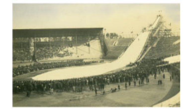
全日本スキージャンプ甲子園大会(1938年)