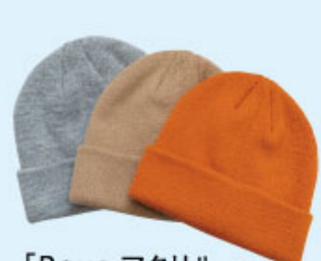
「Roue アクリル ニットワッチ」各2,090円