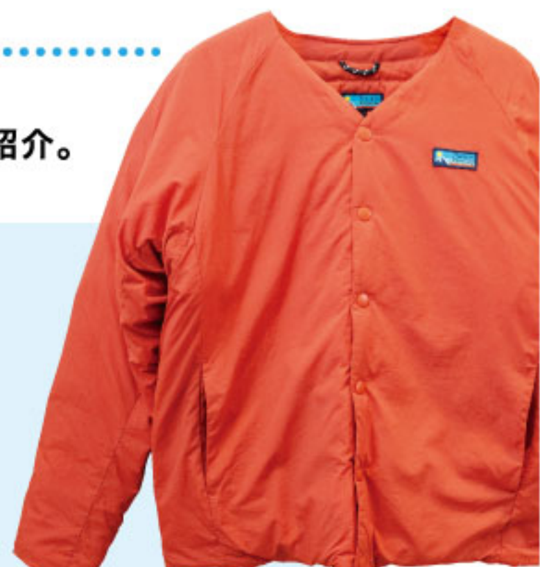
「Franklin Climbing ダウンカーディガン」 19,800円